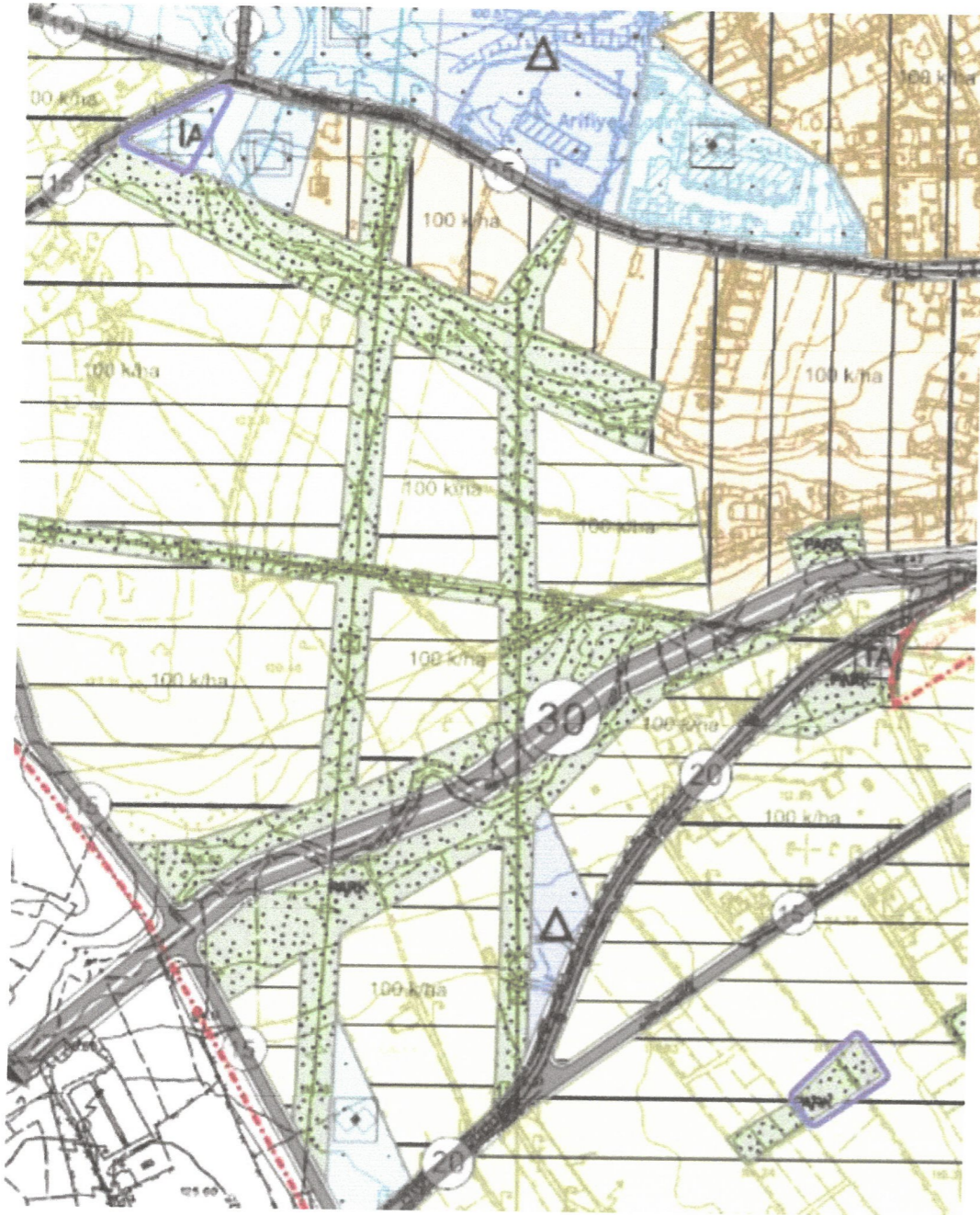
MEVCUT PLAN (1/5000)